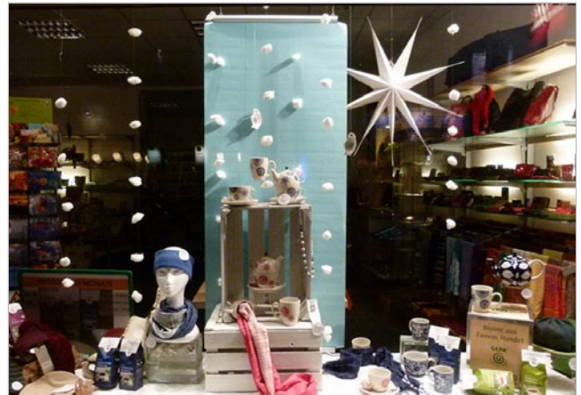
Warmes für die kalte Jahreszeit: Tee und kuschlige Accessoires „im Schneegestöber“ dekoriert.

Fragen sind bei der Planung hilfreich: Welche Gegenstände ergänzen das Hauptprodukt sinnvoll? Welche Farben und Materialien unterstreichen optisch seine Wirkung? Welche besonderen Qualitäten und Merkmale kann man herausstellen? Herausragende Merkmale können Sie auch explizit auf einem schön gestalteten Produktschild hervorheben (z.B. „Büffelleader, chromfrei gegerbt“).