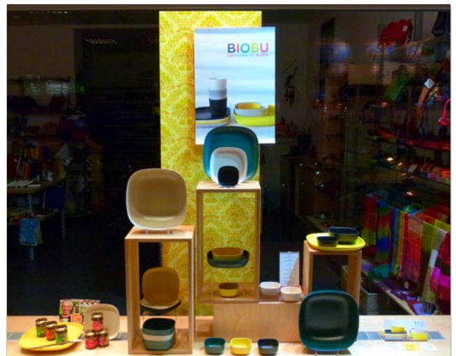
Stylisches für die Küche: Das moderne, schlichte Design wirkt auch ohne aufwändiges Dekorationsmaterial.

Sie für Ihre Dekoration daher immer eine Überschrift und folgen Sie bei der Gestaltung diesem roten Faden. So erzählen Sie eine Geschichte, die bei Ihren Kund/innen Assoziationen und Stimmungen weckt.