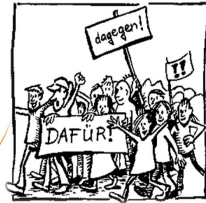
● Politische Kampagnen